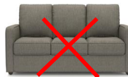
Canapé, canapé-lit, etc.

En général les objets qui dépassent 1m 3 de volume