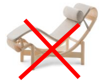
Chaise longue, etc.