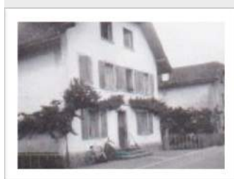
La maison familiale