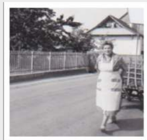
Maman Gehrig qui me conduit