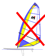
planches à voile