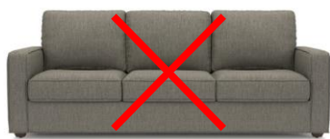
Canapé, canapé-lit etc.

En général les objets qui dépassent 1m 3 de volume