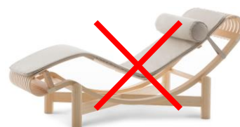
Chaise longue, etc.